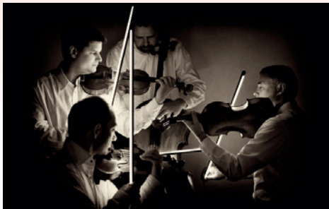
Quatuor Talich et l'orchestre de la Chapelle